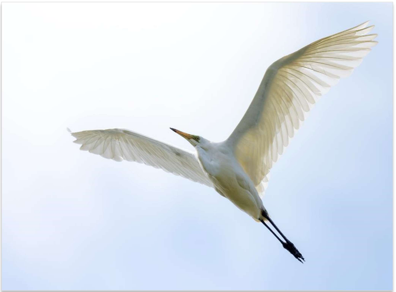
Grote zilverreiger

slankere lichaamsbouw en een spierwit verenkleed. Ze hebben zwarte poten en een oranje bek. Grote Zilverreigers werden in de voorbije eeuwen nog harder vervolgd dan Blauwe Reigers. Het duurde dan ook nog veel langer vooraleer die soort ook langzaam uit het dal kon klimmen. De laatste jaren lukt dat steeds beter. Grote Zilverreigers broeden niet in de streek. We zien de soort hier op trek in lente en herfst en tijdens de winter. In recente winters zit er een handvol exemplaren in de regio. Je kan ze zien in weilanden, maar ook op akkers. Grote Zilverreigers eten graag kleine knaagdieren (net als Blauwe Reigers trouwens) en die vinden ze in akkers en weilanden. Even goed gaan ze vissen in ondiep water, maar die habitat is bij ons niet veel te vinden. De Grote Zilverreigers die we hier zien, zijn vooral afkomstig van toenemende broedpopulaties in Centraal- en Oost-Europa.